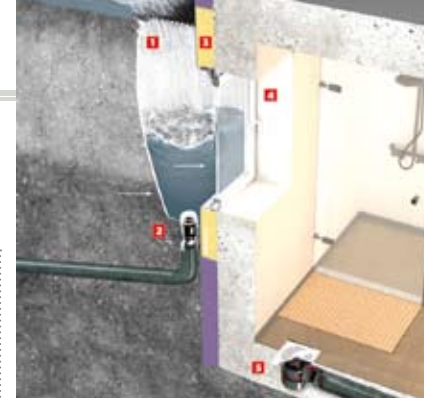
1) Druckwasserdichte Lichtschächte, 2) Rückstausicherung für Lichtschächte, 3) wärmebrückenfreie und druckwasserdichte Lichtschachtmontage auf Montageplatten, 4) hochwasserdichte Kellerfenster, 5) Rückstausicherungen für Kellerentwässerung.

der Ionit healthcare GmbH die jüngsten Studienergebnisse. »Die Luftionen haben wir nicht erfunden, aber mit Ionit Wandcreme ist es uns gelungen, eine natürliche Beschichtung zu entwickeln, welche selbstständig und dauerhaft Luftionen generiert und dadurch messbare gesundheitsfördernde Eigenschaften zeigt.«