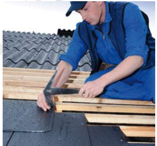
Der Windsogrechner von Eternit informiert, wann zusätzliche Sicherungen nötig sind.