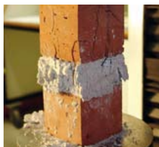
Anhand zahlreicher Materialtests – hier ein Druckversuch – entwickelten die Bauingenieure Materialkennzahlen.