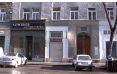
Viele Erdgeschoße in Wien stehen leer. Das müsste nicht sein.

– auch in Wien«, meint Bretschneider. Immobilienspekulanten hätten oft gar kein Interesse an der Bewirtschaftung der Erdgeschoßräume: »Ein billiger Mietzins senkt den Wiederverkaufswert. Da kann es attraktiver sein, das Erdgeschoß gleich ganz leer stehen zu lassen.« Für Betriebe sind die – speziell im Altbau – oft hohen Investitionskosten für eine zeitgemäße Sanierung eine unüberwindbare Hürde. Dabei ist das Erdgeschoß laut Bretschneider der Bereich, in dem eine Stadt sich entfaltet, in dem Gemeinschaft und öffentlicher Raum entstehen können. »Aber dazu braucht man gemeinsame Konzepte, die für die vielen Beteiligten sinnvoll sind.« Als Vorbild könnte Berlin dienen: Dort gibt es öffentliche Förderungen für Verbesserungsmaßnahmen in Freiräumen wie Höfen und Straßen. Kleine Unternehmen, die sich im Erdgeschoß ansiedeln, werden anfänglich unterstützt. Dabei muss es gar nicht um finanzielle Zuwendungen gehen: »Für Kleinunternehmen kann es schon sehr hilfreich sein, gewisse Auflagen und Vorschriften anfangs zu lockern«, stellt Bretschneider fest.