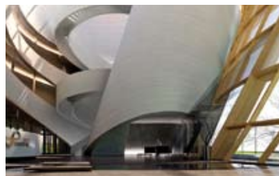
Das geplante Foyer des Technologieparks in Düzce: Geschwungene Formen aus Vierecken.

viereckigen Einzelteilen. Nur durch komplizierte mathematische Methoden wurde es möglich, die fast ebenen Vierecke zu einem komplexen, organisch-runden 3D-Puzzle zusammenzufügen. Runde Formen durch viele einzelne Dreiecke anzunähern, ist kein Problem – in der Mathematik bezeichnet man das als Triangulierung. Drei