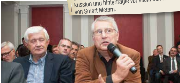
Das Publikum beteiligte sich rege an der Diskussion und hinterfragte vor allem den Nutzen von Smart Metern.