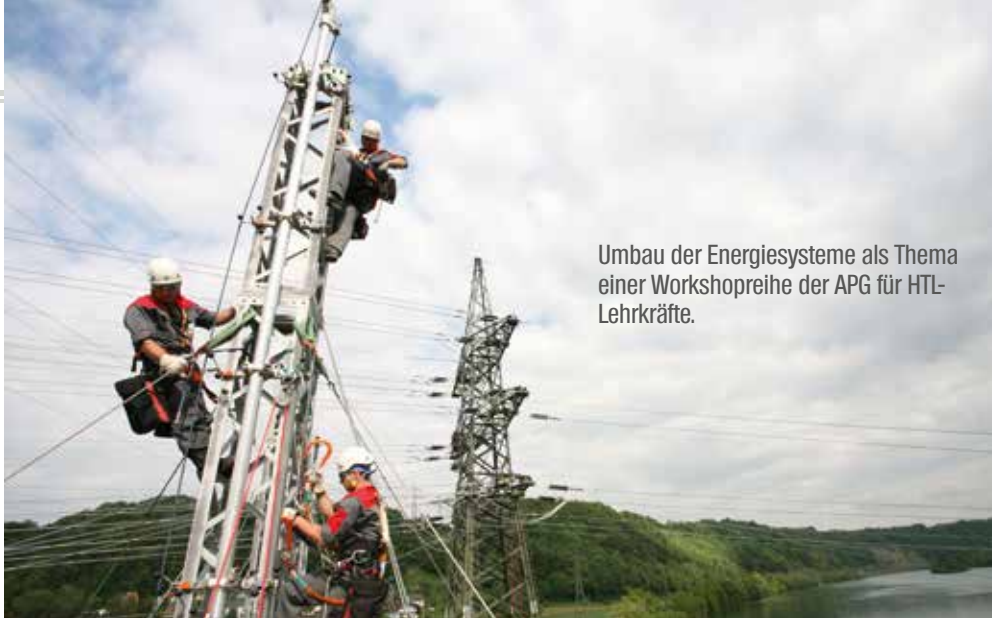
Umbau der Energiesysteme als Thema einer Workshopreihe der APG für HTL-Lehrkräfte.

➤ Rekordjahr. 2013 war ein starkes Photovoltaik-Jahr mit einem neuen Rekordergebnis. »Für dieses Jahr rechnen wir mit einem Zubau an Photovoltaikleistung von über 250 Megawattpeak« so Hans Kronberger, Präsident vom Bundesverband Photovoltaic. Österreich hat mit Ende des Jahres somit eine kumuliert installierte Photovoltaikleistung von 612,9 Megawattpeak. Ein besonders großer Anteil der heuer installierten PV-Anlagen kam durch die Ökostromtarifförderung zustande – 150 Megawattpeak. Weitere rund 63 Megawattpeak wurden durch den Klima- und Energiefonds gefördert. Beachtlich ist auch eine zusätzliche Förderung vom Land Steiermark, die 2013 weitere 27 Megawattpeak ermöglicht. Auch der Anteil von Anlagen ohne Förderung steigt.