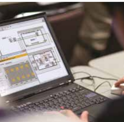
Grafisches Systemdesign von National Instruments und BEKO Graz.

BEKO Graz ist eine der ersten Adressen für individuelle Lösungen in der Mess- und Automatisierungstechnik. Am steirischen Standort des heimischen Technologiedienstleisters werden seit vielen Jahren Projekte für Unternehmen aller Branchen realisiert. Kunden profitieren dabei auch von der intensiven Zusammenarbeit mit National Instruments (NI), einem weltweit er-