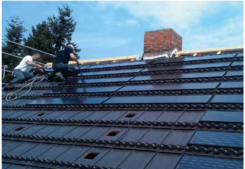
»MS 2Power«-Module fügen sich harmonisch in das Dachbild ein. Sie sind regen- und sturmsicher.

Mit den Hard- und Software-Komponenten von NI können Wissenschaftler und Ingenieure leistungsfähige Applikationen für die verschiedensten Anwendungen konfigurieren. »Das Besondere ist die intuitive Bedienoberfläche, die es dem Endanwender mit etwas Know-how ermöglicht, einfache Systeme selbst zu entwickeln. Wir von BEKO kommen als Silver Alliance Partner von NI ins