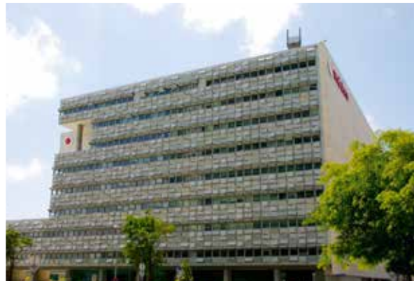
Vodafone-Gebäude in Lissabon: zuerst hohe Energierechnungen, dann intelligentes Energiemanagement mit »Desigo Insight«.