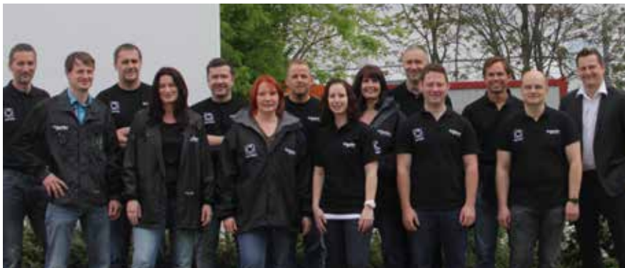
Schneider Electric ist für seine Servicesparte derzeit auf der Suche nach gut ausgebildeten Fachkräften – mit Skills aus der IT ebenso wie Energietechnik und Elektronik.

Trentler: Die IT-Branche liegt dazu heute auch etwas voran. Den Ausfall eines Rechenzentrums kann sich kein IT-Anbieter leisten. Und glauben Sie mir: Wenn etwas passiert, dann passiert das – frei nach Murphys Gesetz – stets zeitnah mit anderen Problemen. Wir sehen diesen Vorsprung im Serviceverständnis