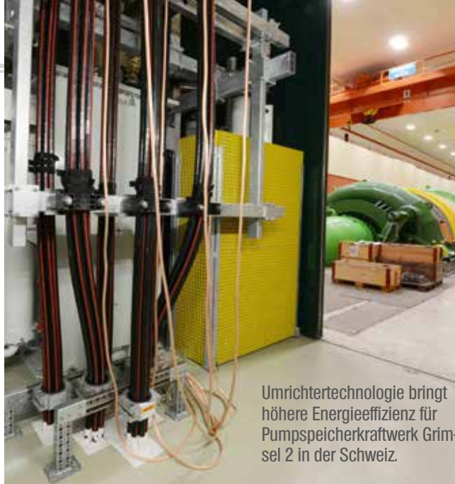
Umrichtertechnologie bringt höhere Energieeffizienz für Pumpspeicherkraftwerk Grimsel 2 in der Schweiz.