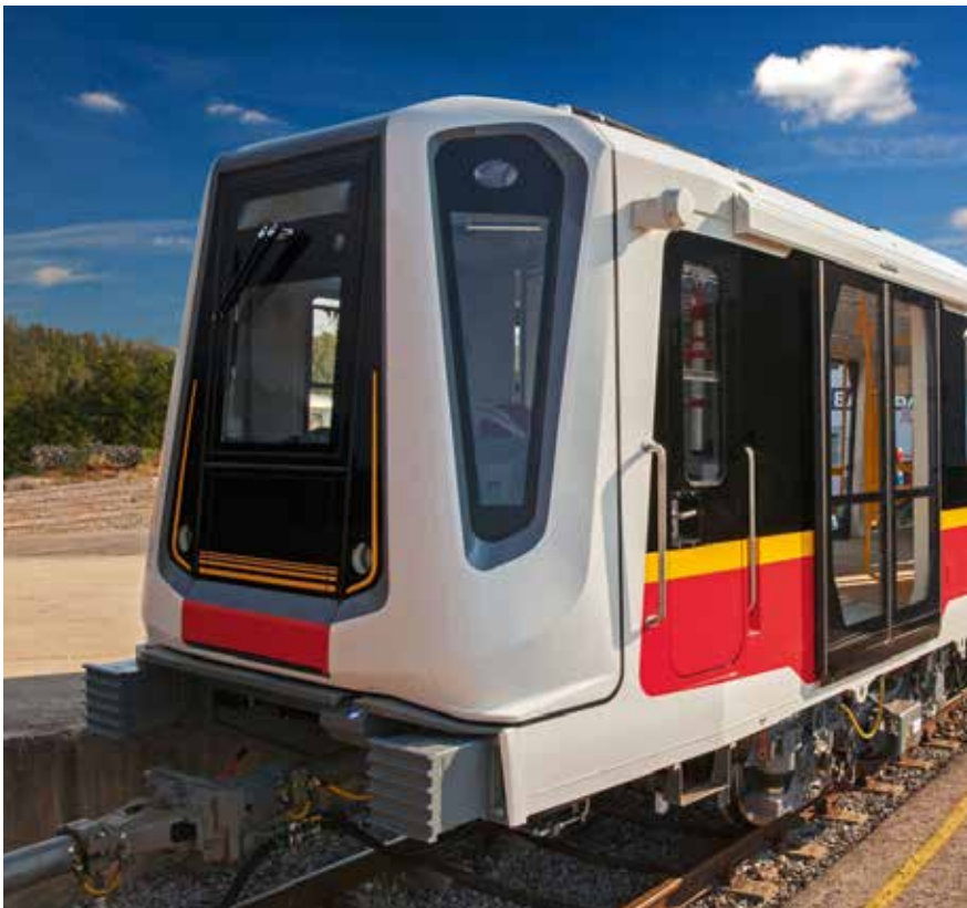
Ecodesign-Preis für Inspiro, die Metro-Plattform aus Simmering.

Energieeffiziente, umweltfreundliche Metro aus Wien Simmering im futuristischen Design: Inspiro ist bereits in Warschau im Einsatz und punktet mit einer Recyclingrate von fast 95 Prozent.